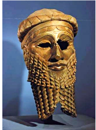
Kungligt brons huvud från Nineve (c:a 2300 f.Kr.)

Man hittade Nineves ruiner på 1820-talet. När man väl grävde fram platsen gjordes mängder av fynd. Man fann bland annat ett bibliotek som var skrivet med kilskrift på lertavlor. I Jonas bok kallas Nineve för "den stora staden" (3:1) som "var tre dagsresor lång" (3:3-4) och hade 120 000 invånare (4:11). Nineve var befäst med höga murar. Att staden var så vidsträckt berodde på att floden Khosr flöt rakt genom staden. Khosr var en biflod till Tigris som flöt alldeles intill.