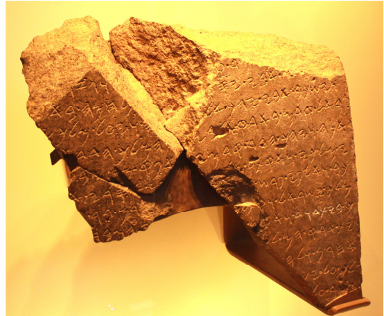
En stele från 800-talet f.Kr funnen 1993 i Dan i Israel. Stelen är skriven på arameiska av Arams kung Hasael (842-805 f.Kr). På stelen säger Hasael att han besegrade Israels kung Joram och Judas kung Ahasja från Davids hus. Det slaget skedde 841 f.Kr (2Kung 8:28-29). Ahasja var pappa till Joash och son till Attalja.

Jojada satte genast igång med att rensa bort avguderiet från landet (2Krön 23:16-17). Han såg till att tempeltjänsten kom igång (2Krön 23:18-20) och att templet restaurerades (2Krön 24:1-14).