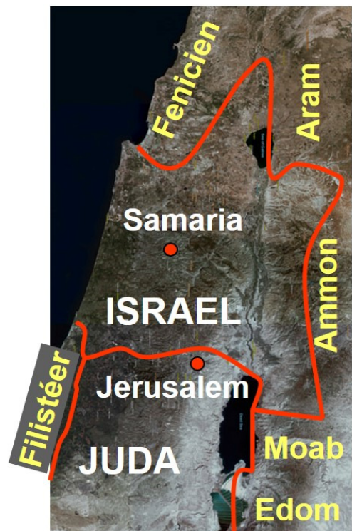
Riket delades år 931 f.Kr. Runt Israel och Juda låg flera småriken

Vi förutsätter att vi befinner oss i Joash tidiga regering när prästen Jojada styrde och Joash ännu var ett barn.