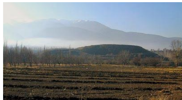
Kullen i förgrunden är Kolosse

Kolosseförsamlingen var en ganska ung församling när Paulus skrev brevet. Det är fullt möjligt att församlingen grundades under Paulus tid i Efesus mellan år 54-57 e.Kr. (Apg 19:8-10). Församlingen var grundad av Epafros (Kol 1:7-8) och han var från Kolosse (Kol 4:12). Epafros kände väl