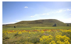
Lystra i södra Turkiet

Timoteus kom från Lystra, en stad i den sydvästra delen av det nuvarande Turkiet (Apg 16:1). Hans far var grek och hans mor judinna. Timoteus hade vuxit upp i den judiska tron och han hade sedan barnsben fått en gedigen undervisning i GT av sin mor Eunice och sin mormor Lois (2Tim 1:5, 2Tim 3:15).